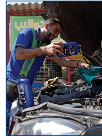
محطة طبر - إهدن