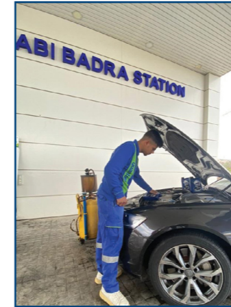
محطة أبي بدرا - شكا

شركة أي بي تي الموزعة الرسمية لزيوت ELF في لبنان.