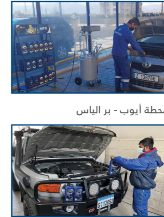
محطة أيوب - بر الياس