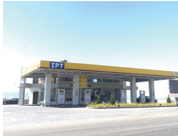
محطة البرهان - عمارة البيكات