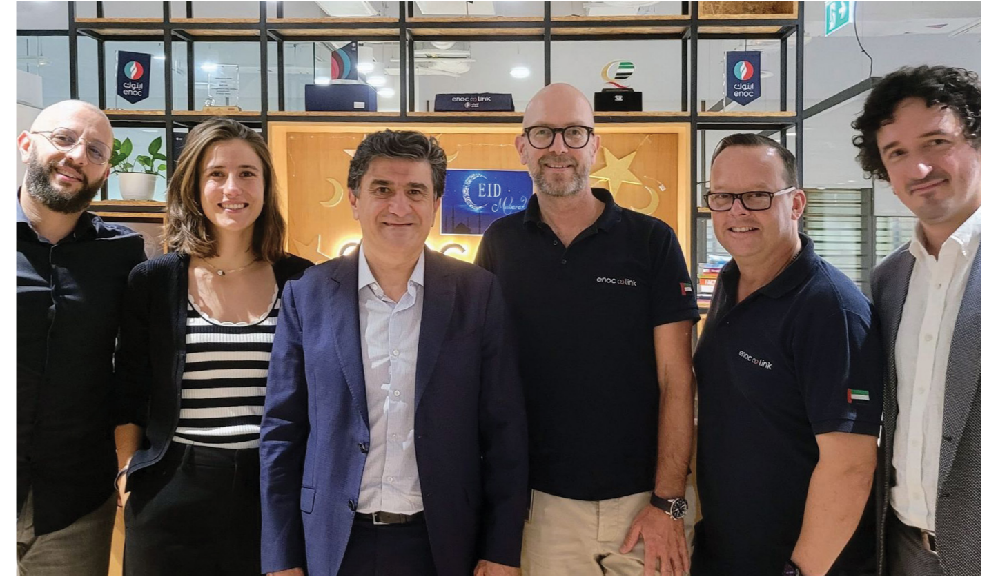
صورة جماعية لعقد الشراكة

أعلنت شركة أي بي تي أنرجي عن أحدث شراكاتها في دولة الإمارات العربية المتحدة وذلك عبر توقيع اتفاق تجاري مع ENOC Link، هي شركة تابعة لشركة بتروك الإمارات الوطنية (إينوك). تحدد الاتفاقية الإطارية بين أي بي تي أنرجي و ENOC Link مجالات التعاون في تجارة النفط، والدعم اللوجستي، فضلاً عن الاستثمار في مجال الطاقة. هذه الشراكة الجديدة مع ENOC Link هي شراكة استراتيجية تتماشى مع سياسة أي بي تي أنرجي التوسعية في المنطقة التي انطلقت من دولة الإمارات العربية المتحدة. وها إن الشركتين، تتطلعان الآن لإغتنام هذه الفرصة الجديدة معاً في المنطقة.